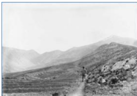
Le Seuil – Vaucluse 6 juin 1903, Photo RTM et août 2004, Photo David Huguenin

Les Archives et la Bibliothèque départementales vous présenteront chaque semaine un ouvrage issu de leur collection de documents historiques numérisés .