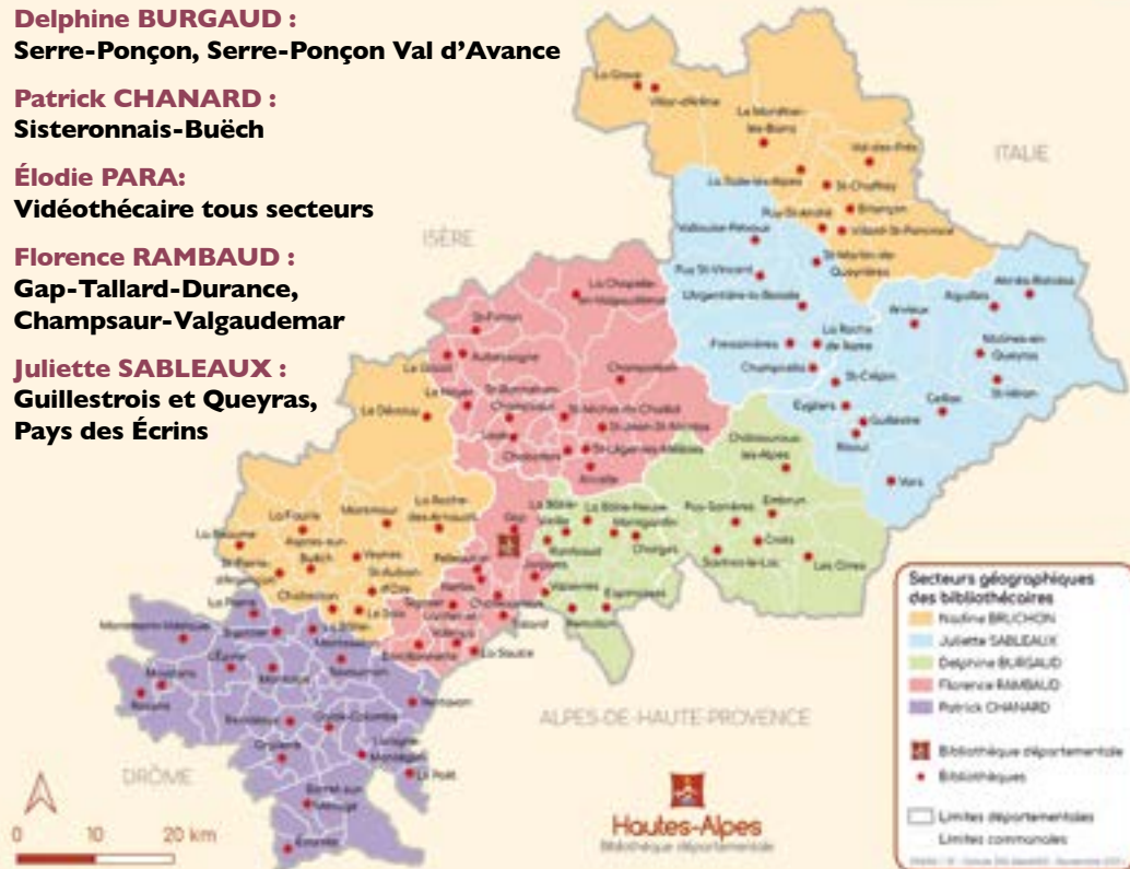
LES SECTEURS GÉOGRAPHIQUES DES BIBLIOTHÉCAIRES

Juliette SABLEAUX : Guillestrois et Queyras, Pays des Écrins